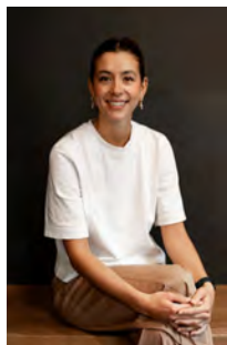
Klara Betriebsleitung & Vertrieb