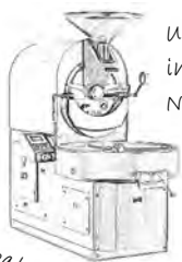
Unser Trommelröster in der Weißgerbergasse, Nürnberg.

Als Mitglied der Specialty Coffee Association arbeiten wir ausschließlich mit Kaffeebauern und Händlern, die mindestens dieselben Ansprüche stellen wie wir: Ökologischer und nachhaltiger Anbau, höchste Bohnenqualität und fairer Handel.